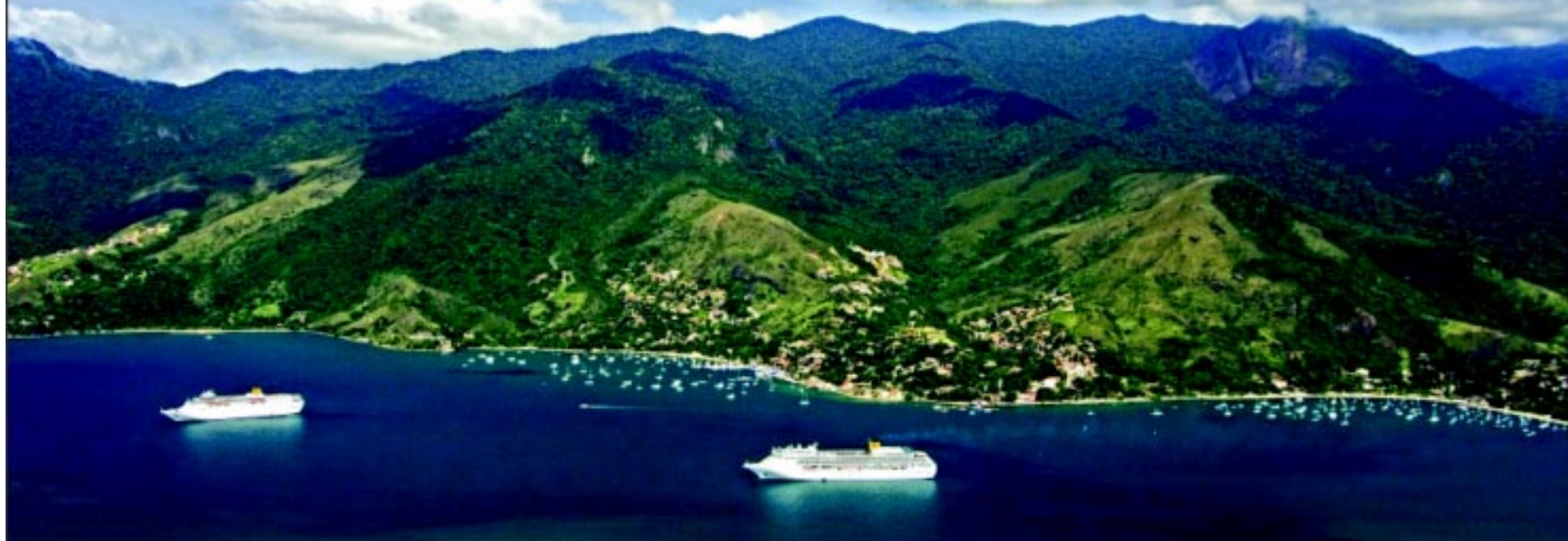
Tabela de Escalas de Navios de Cruzeiro Temporada 2006/2007